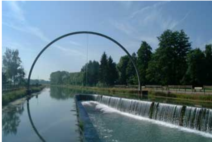
Sculpture Rinke, 10270 Lusigny-sur-Barse